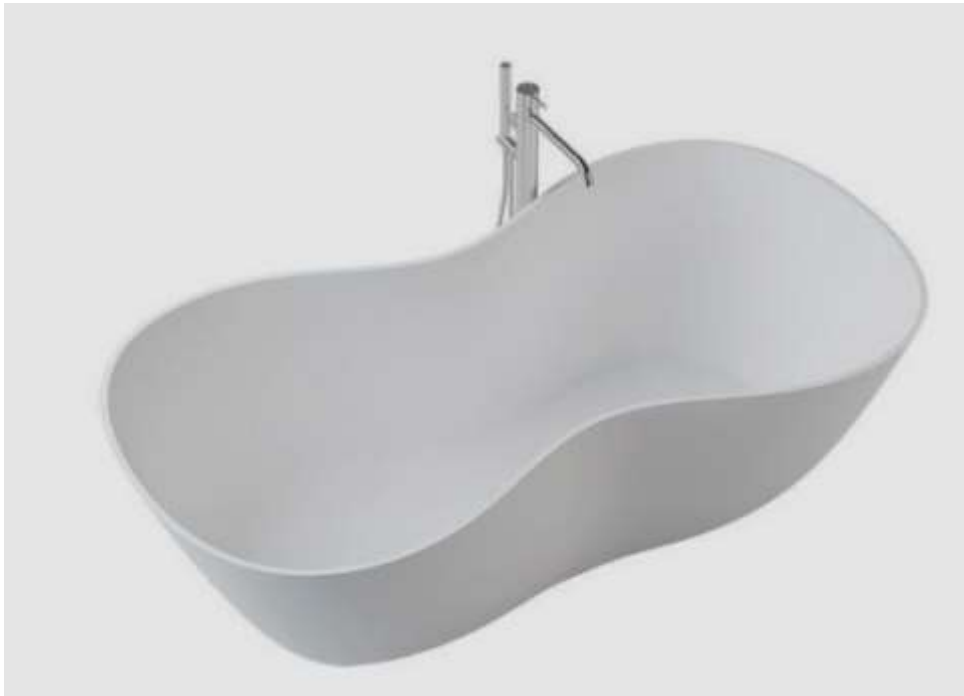
새턴바스_카림라시드 외 2인

올해 20주년 맞이한 서울디자인페스티벌이 기획하고 70년 정통을 가진 노루페인트가 공간의 컬러를 넣어 세계 디자인 거장들의 작품을 보여주는 기획전을 준비하고 있습니다.