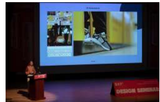
스튜디오 택트/ 베단 로라 우드/ 리 머로우 * 2019년 연사